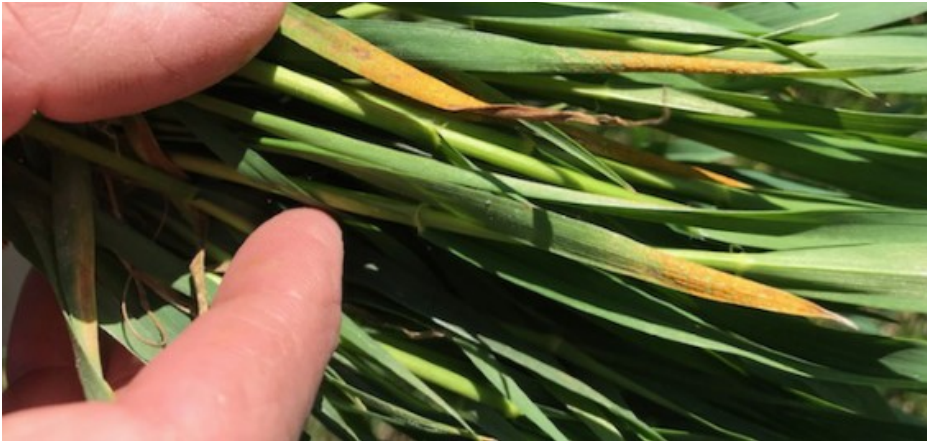
Billede 1. Gulrust i Kalmar hvede fotograferet 8. maj 2018 af Bent Buchwald, VKST.